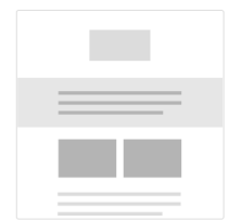
1:2:1 Column - Full Width