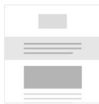
1 Column - Full Width