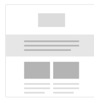
1:2 Column - Full Width