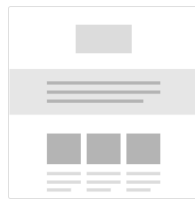
1:3 Column - Full Width