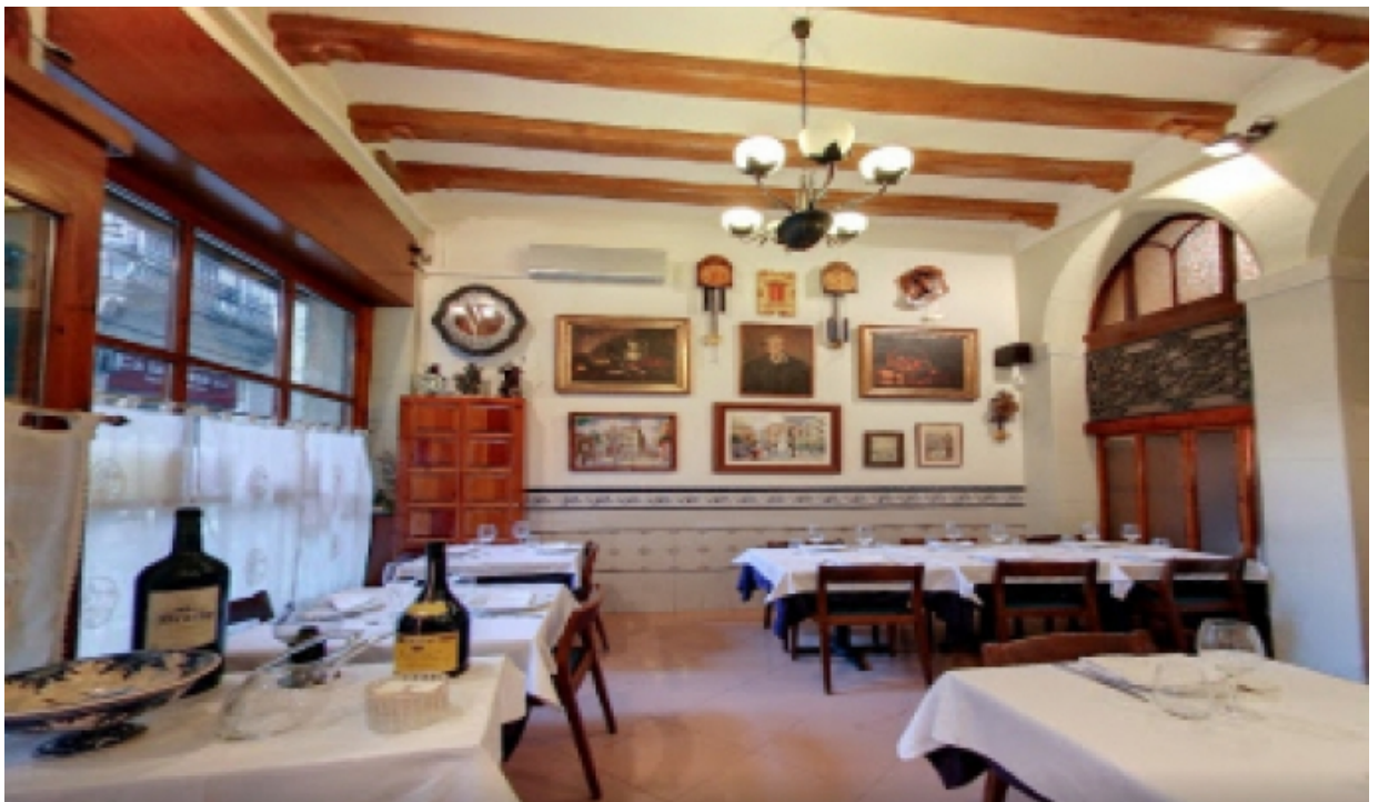
Fotografia de l'interior del Restaurant Pitarra