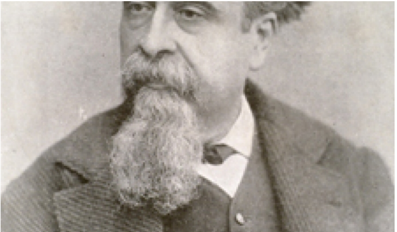
Retrat de Frederic Soler, més conegut com a Serafí Pitarra