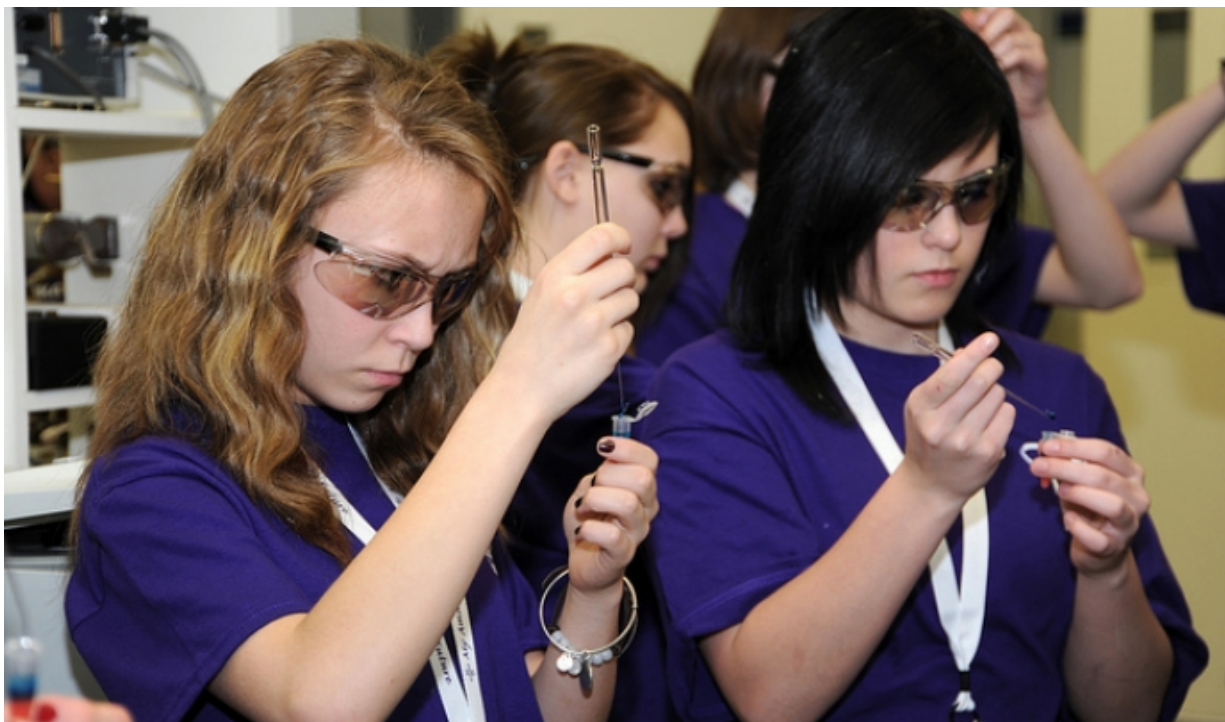
Noies fent un experiment de ciències