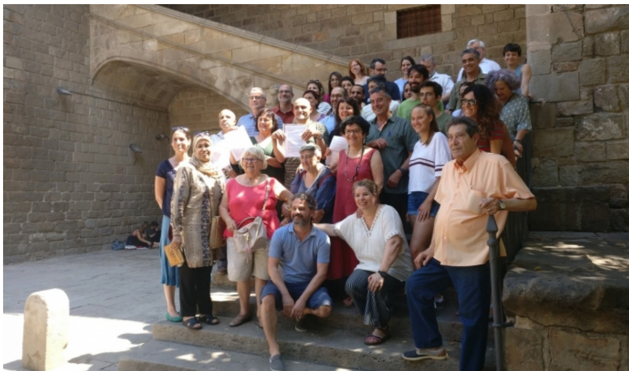
Foto de grup de les persones representats dels col·lectius que signen el manifest 'Compromís comunitari per un barri lliure de tràfic de drogues'