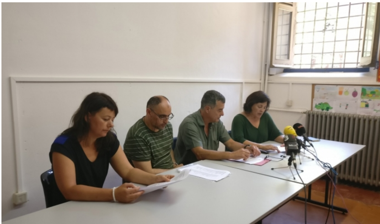
Roda de premsa per presentar el manifest 'Compromís comunitari per un barri lliure de tràfic de drogues'