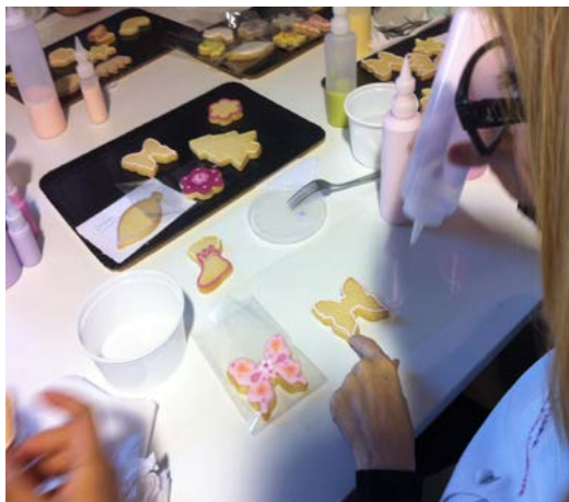
Fusió de Sucre

Avinguda Drassanes, 1 / 666939998 bcnnorai@gmail.com, impulsem@impulsem.org www.impulsem.org