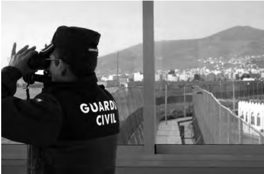
Frontera de Melilla.