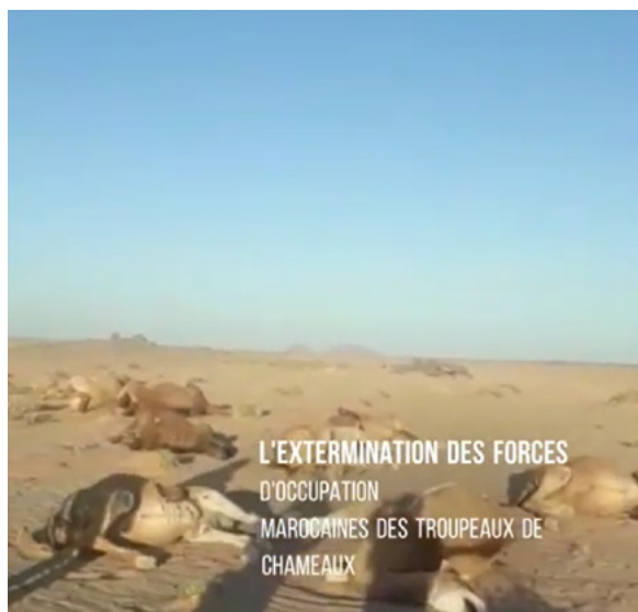
Captura d'un vídeo que denuncia la massacre d'un ramat de camells.

Aquest tipus d'atacs són potencialment constitutius de crims de guerra sota l'Estatut de Roma del Tribunal Penal Internacional i per incomplir les obligacions de la Potència ocupant respecte de la població civil protegida, vulnerant els articles 31, 32 i 33 de la IV Convenció de Ginebra de 1949.