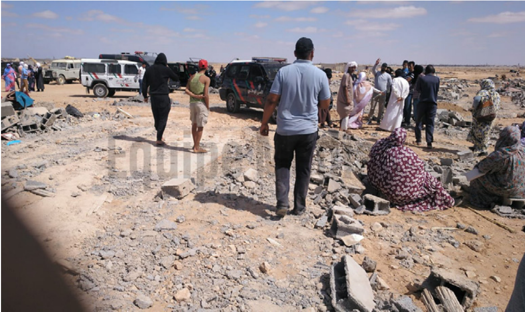
Destrucció dels habitatges d'un 'grayer' al setembre de 2020

la construcció de la masculinitat en les societats patriarcals, que assenyalava als homes joves com a subjectes potencialment perillosos 85 .