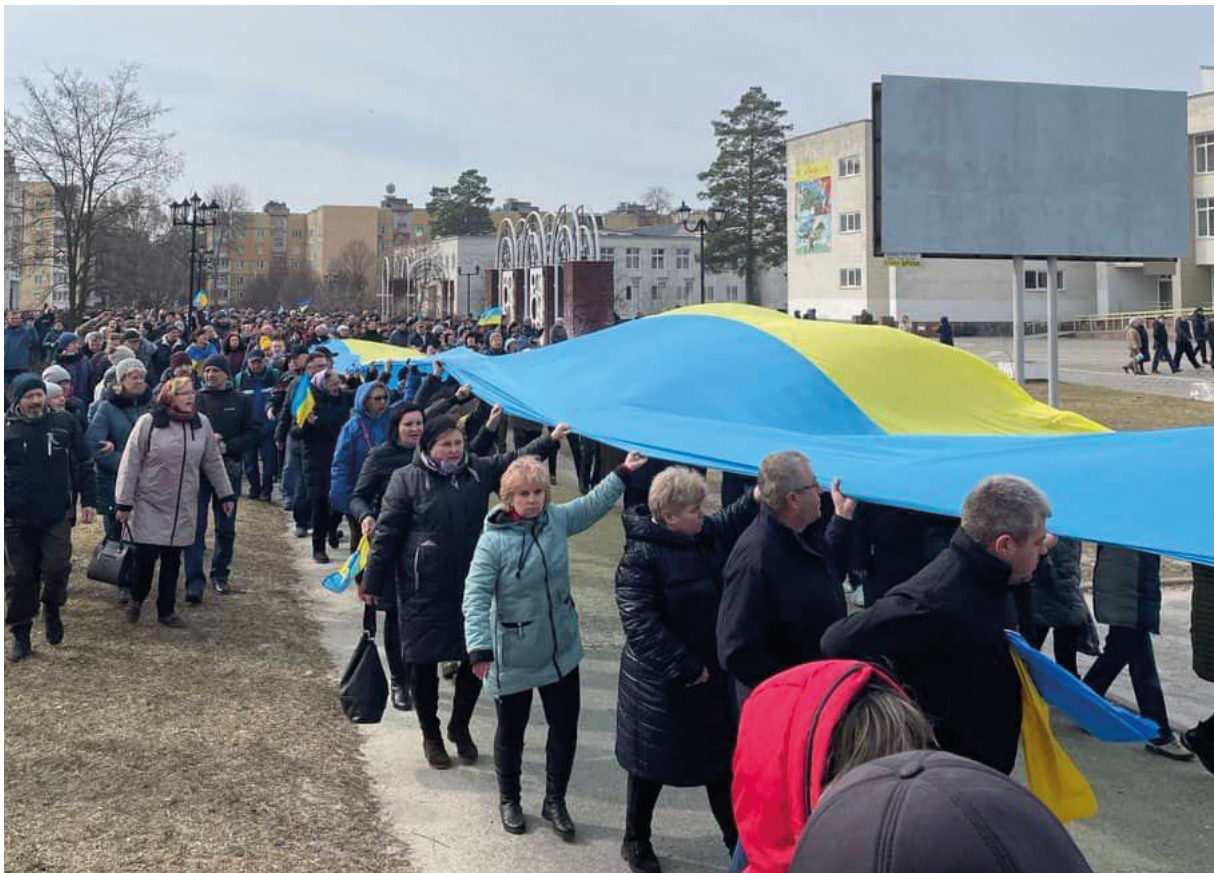
Manifestació a Slavutich desplegant una gran bandera ucraïnesa.