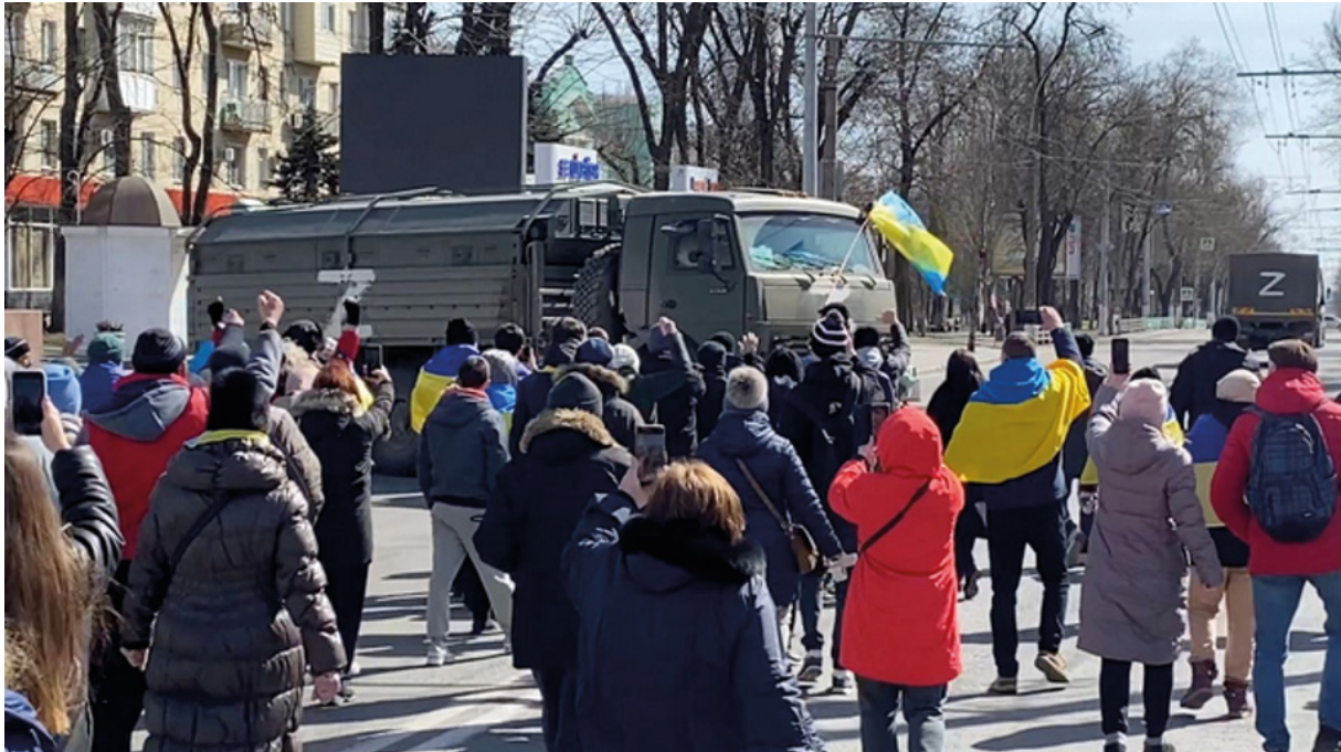
Població local porta a terme una acció d'interposició no violenta directa per evitar el pas d'un comboi militar rus a Kherson.

sud d'Ucraïna, les accions d'interposició i obstrucció no violenta de tancs i combois militars van alentir l'avenç de les tropes russes. A més, els sistemes de comunicació alternatius van ser eficaços per al reconeixement d'agents prorussos i sabotjadors en ciutats com Kíiv, Txerníhiv o Sumi, ja que van debilitar els objectius militars per controlar aquestes ciutats. Tot i que sigui difícil avaluar-ho d'una manera precisa, la resistència civil no violenta ha contribuït a frenar la invasió al nord del país.