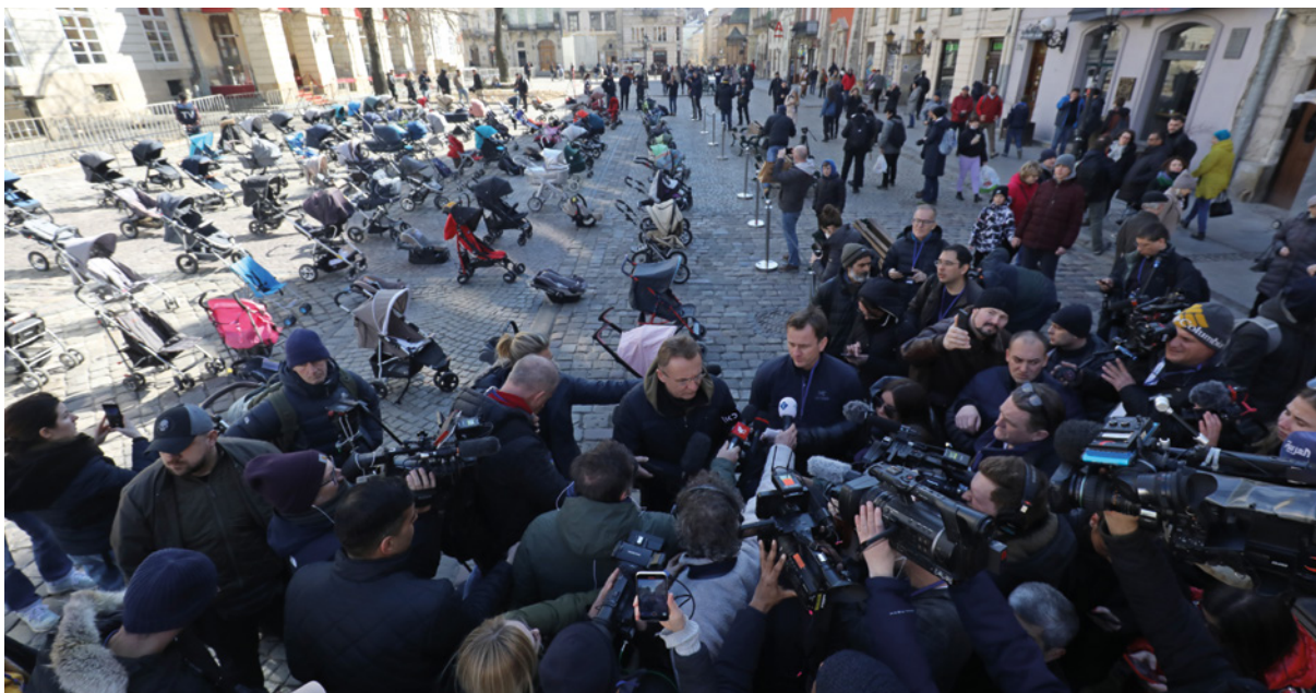
L'acció simbòlica amb 109 cotxets buits a Lviv per denunciar l'assassinat de nadons i infants capta l'atenció de mitjans internacionals.