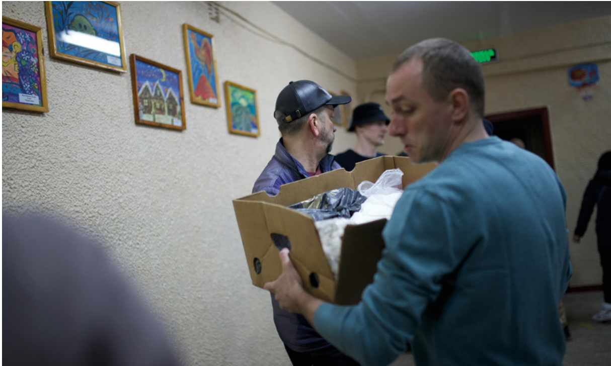
Cadena humana a Slavútix per descarregar un camió d'ajuda humanitària.

Organitzacions que treballen en el monitoratge de la propaganda russa i el desenvolupament de noves narratives noviolentes han mostrat la seva incapacitat per penetrar amb contranarratives noviolentes en aquesta societat. En el bloc occidental també existeixen dificultats per incidir en el debat públic dominat per les narratives militaristes i pro-OTAN.