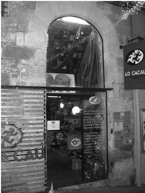
Botiga de Comerç Just "Lo Cacau".

En aquesta direcció, i sota el paraigua de l'Associació del Comerç Just de Lleida, creada l'any 1998, es va obrir al carrer Cavallers la que aleshores va ser l'única botiga de comerç just de Lleida: Lo Cacau. No obstant això, aquest projecte tan ambiciós es va veure obligat a tancar, com moltes altres petites botigues independents de comerç just a l'Estat espanyol, a finals de 2007.