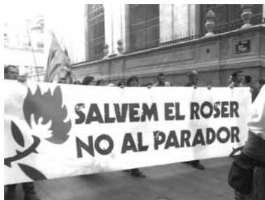
Manifestació per demanar que al Roser no si faci un parador nacional (espanyol) de turisme, i es destini a usos públics culturals i socials. Ocell Negre (2009)