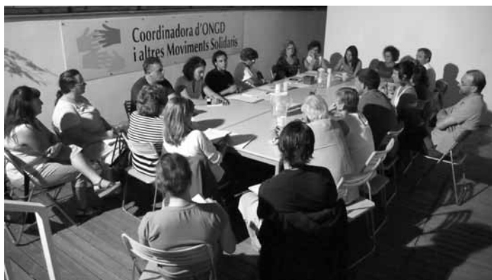
Assemblea Coordinadora d'ONGD i aMS de Lleida.

“Red de relaciones informales entre individuos, grupos y organizaciones que, en sostenida y frecuentemente conflictiva interacción con autoridades políticas y otras élites, y compartiendo una identidad colectiva no necesariamente excluyente, demandan públicamente cambios (potencialmente antisistémicos) en el ejercicio o la redistribución del poder en favor de intereses cuyos titulares son indeterminados e indeterminables colectivos o categorías sociales.”