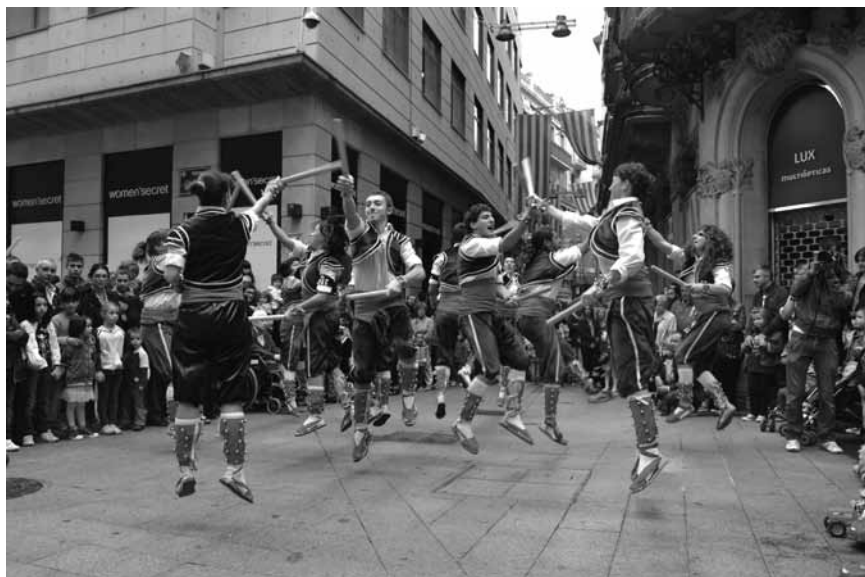
Bastoners del Pla de l'Aigua, una secció del casal que promou la cultura popular de la ciutat Ocell Negre (2012)

Més enllà de l'àmbit metropolità, però seguint a les terres de Ponent, també s'està intensificant la coordinació amb la resta d'iniciatives del territori.