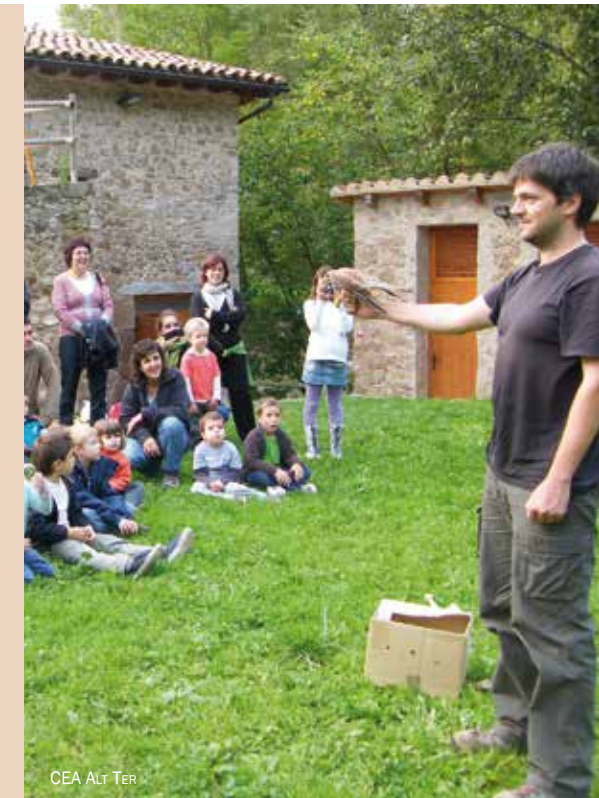
CEA ALT TER

Aconseguir i captar fons i recursos econòmics per poder realitzar totes les activitats anteriors.