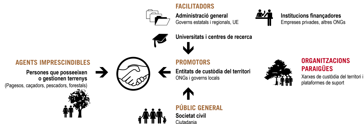
Figura 1. Agents implicats en la custòdia del territori

Més informació: http://agroterritori-iaeden.blogspot.com.es/p/enllacos-i-documents.html www.gobmenorca.com/custodiaagraria www.xct.cat/custodiaagraria