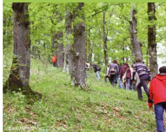
LAIA JIMÉNEZ - XCT

Si bé han d'afrontar molts reptes, les entitats de custòdia també ofereixen un gran potencial en diversos sentits: 1) moltes persones propietàries de terrenys estan més obertes a col·laborar amb entitats privades de custòdia -i millor si són d'àmbit local- que amb administracions públiques; 2) els acords de custòdia poden aportar beneficis materials a la propietat; 3) en ser més flexibles, les entitats de custòdia poden respondre més ràpidament a les oportunitats i dificultats que sorgeixin.