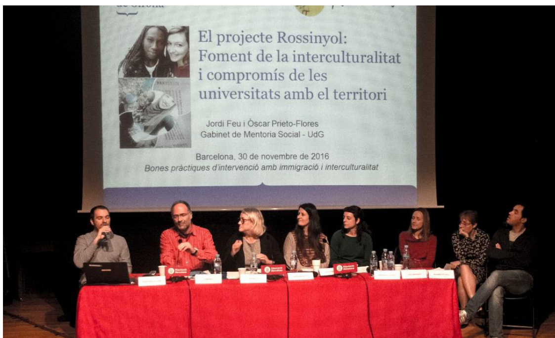
Taula de debat sobre educació

Intervenció comunitària intercultural: joves, identitat i sentiment de pertinença. Intervenció comunitària que rep suport d'altres projectes anteriors, amb l'objectiu de generar sentiments de pertinença, convivència i participació social d'entre joves de 15 a 25 anys a Tortosa.