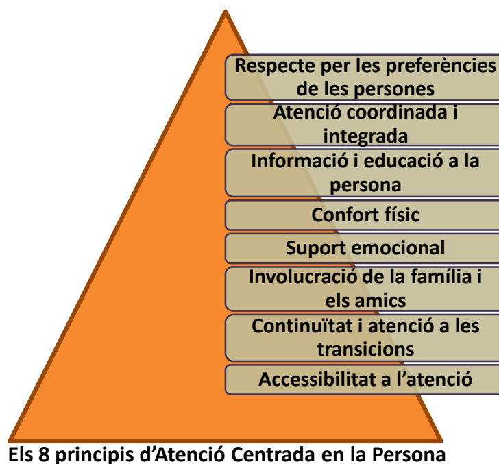
Fig. 3. Els vuit principis de l'ACP.

En aquest context, les dimensions que proposen institucions referents com ara la l'Escola Mèdica de Harvard i l'Institut Picker poden ser de gran utilitat per construir futurs marcs avaluatius (Picker Institute, 2015).