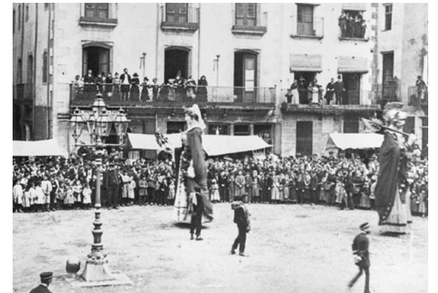
Ball de gegants d'Olot, 1890.