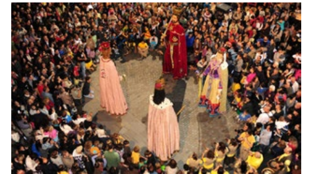
Ball de gegants durant el pregó de les Festes de Sant Narcís del 2012.

Totes aquestes danses esmentades, i més, es poden trobar al Cens de Balls de Gegants de Catalunya que a hores d'ara ja arriba als 630 registres. Uns registres que, ara per ara, no són públics i estan a l'espera de donar-se a conèixer. Balls que es fan o s'han fet en algun moment de la història recent i que permet, d'alguna manera, que no es perdi l'esforç entorn la dignificació de les figures a través del seu ball i la seva música.