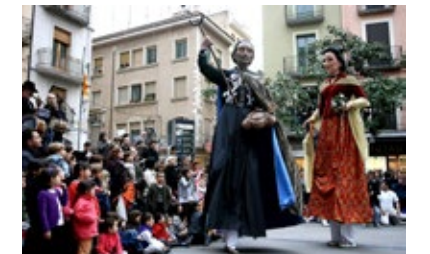
Els gegants de Figueres fent el seu ball durant les festes de la Santa Creu.

A l' Inventari de danses vives de Catalunya hi trobem més de cent-cinquanta balls de gegants de més de vint-i-cinc comarques d'arreu del país i de diversa tipologia, als que caldrà afegir la quantitat dels que encara no s'ha inventariat. Un bon nombre són balls de parella de gegants: home i dona, però també en podem trobar d'una peça sola, de dos gegants amb forma d'home o dona, i fins i tot per a conjunts de quatre peces o més. Queda molta feina per fer a la que tothom hi pot col·laborar facilitant-nos