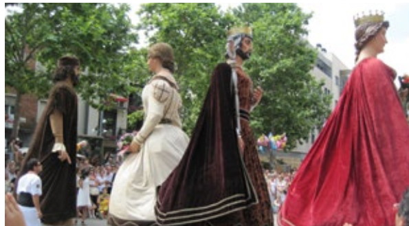
Els gegants de Terrassa fent el seu Ball de Festa Major de Sant Pere de 2014.

Per això, només em resta expressar: gràcies colles pels vostres balls de gegants!