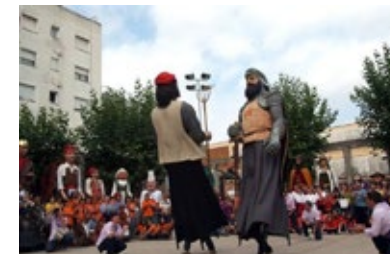
Els gegants de Montornès ballant la Dansa de la Batalla durant la Festa Major.

A més dels gegants que s'han mantingut en actiu travessant dècades o segles, en els darrers quaranta anys moltes poblacions han incorporat gegants i gegantes a les seves celebracions periòdiques. Alguns són gegants que havien estat oblidats o arraconats per diversos motius o que substitueixen als que fins i tot havien desaparegut, però que sigui com sigui tenen referents, llunyants o recents, a la població o barri on desenvolupen la seva acció.