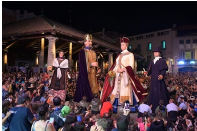
El Ball de Giravoltes de l'any 2019.

Cens de Balls de Gegants hem pogut copsar dues tipologies: el Ball de Plaça i el Ball itinerant. El primer es fa en un espai delimitat, mentre que l'altre té un desplaçament d'un punt A a un punt B. Però per ser més curosos, podríem dir que el Ball de Gegants en si pot ser coreografiat o no. Per tant, l'èxit del ball no coreografiat dependrà, en gran part, de l'experiència i espontaneïtat dels seus balladors/portadors, mentre que el coreografiat dependrà dels assajos previs i experiència dels seus intèrprets. A Sitges, per exemple, els gegants ballen en tot moment tot i que no sigui d'una manera coreografiada en cap moment de la festa. Tot i això cal ressenyar que el pas canvia totalment quan surt la Custòdia del Corpus moment en el qual els gegants i els altres entremesos no ballen sinó que desfilen solemnement sense cap giravolta.