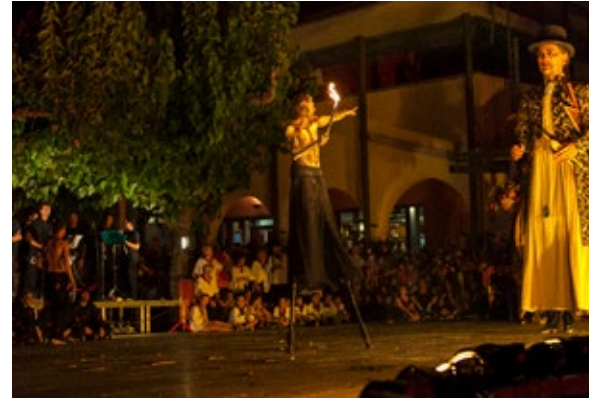
Imatge de l'espectacle anual de la Pedra del Diable de Pareds del Vallès.

Però com dèiem anteriorment la importància del Ball de Gegants rau en la seva ritualització. Per què un ball es mantingui i agafi rellevància cal que s'interpreti, almenys, un cop a l'any dins del seu ritual festiu que pertoca: un pregó, un sant