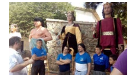
Curs d'iniciació als balls. Premià de Mar, 18/07/2015.

Al 2016 neix el Concurs de Balls de Gegants, organitzat pel cos de monitors. Es celebra bianualment, i té com objectiu difondre, valorar i premiar el ball de gegants. El concurs està obert a totes les colles geganteres, i vol incentivar que les colles apostin per tenir balls amb coreografies.