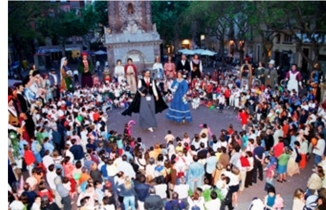
La bella vila de Gràcia va estar celebrant durant uns anys concursos bianuals. A la imatge primer concurs celebrat al 2003.

Una altra dimensió a tenir en compte en el ball de gegants és la música. En aquest punt, també hi ha diversitat d'elements a tenir en compte. Els primers tindrien a veure amb la creació: des