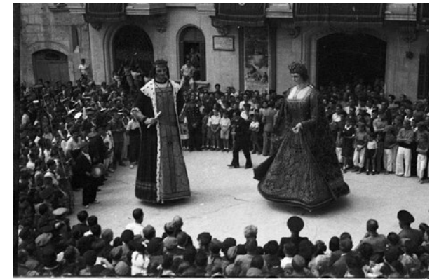
Ball de Gegants a Vilafranca del Penedès. 1939.