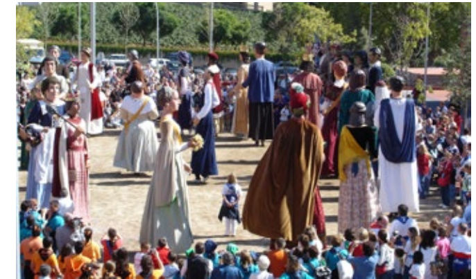
Dansa del Maresme que es va interpretar a Alella l'any 2005.

Els diferents paràmetres que proposem com a definició del ball col·lectiu es diferencia dels tradicionals balls conjunts entre colles, que solem realitzar amb la música "gener, febrer i passi-ho bé", aquests balls no els considero com a col·lectius, pel fet que no hi ha coreografia o correlació entre aquests. Clarifico, no estic dient que aquests balls s'han d'eliminar, sinó, que no els inclouria a la definició de balls col·lectius.