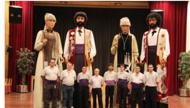
Jornades de treball i enregistrament del Ball de l'Aniversari a la Sala Ibèria de Sant Feliu de Llobregat. 8/7/2012.