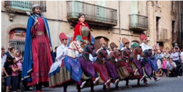
Cavallets i gegants de Sant Feliu de Pallerols durant el seu ball de plaça.