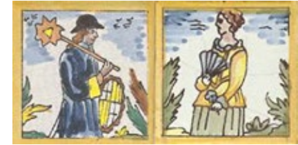
Rajoles del segle XVIII. Col·lecció Jan Grau

De tota manera a partir del 1r Congrés de Cultura Tradicional i Popular els anys 1981 i 1982, i sobretot de 1984 amb la fundació de Colles de Geganters de Catalunya, van augmentar notablement les colles i els gegants, però no els balls, perquè la nova fornada entenia més el portar gegants com una forma d'oci. No es fins a 1989 que l'Agrupació es planteja la necessitat de dignificar i posar en valor en ball de gegants, un any després es publica "Ball de Gegants", fins ara l'únic mètode de ball de gegants i per la Ciutat Geganterera que va tenir lloc a Manresa es va fer la primera mostra de balls. Començava una nova era pel què fa a ballar gegants