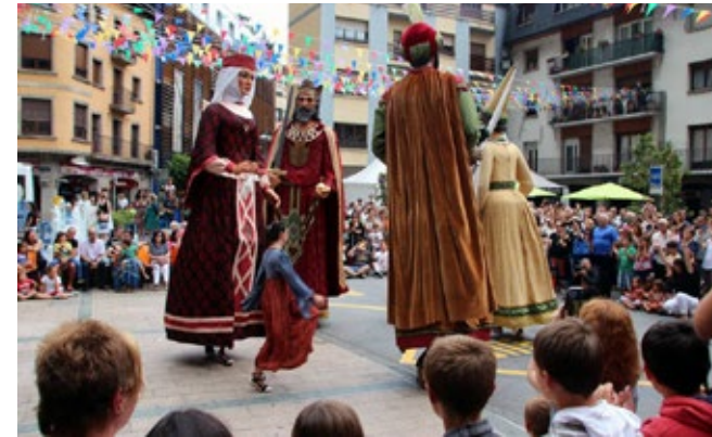
Ball Medieval entre les colles d'Andorra la Vella i Sant Pol de Mar que es fa normalment durant la Festa Major andorrana.