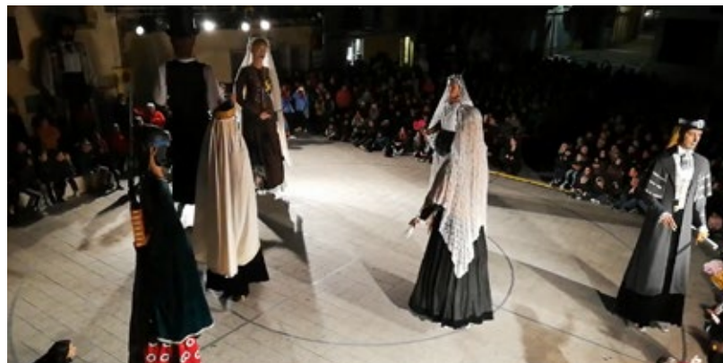
Ball del Ciri fet a Castellterçol amb la presència de quatre colles

Finalment, i no menys important, el ball col·lectiu ha d'estar integrat per més d'una colla gegantera. Aquest és un dels conceptes clau, són moltes les colles geganteres del nostre país que disposen de més d'una parella de gegants, però un ball realitzat pels gegants de la mateixa entitat no l'entendria com un ball col·lectiu. Aquest és un dels conceptes que entenc més rellevants, l'associacionisme és un dels més alts valors del nostre país, i el món geganter ha demostrat saber treballar conjuntament amb altres associacions per fer més fort el món geganter i en definitiva la cultura popular i tradicional de Catalunya.