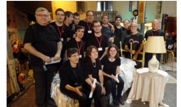
Monitors i col·laboradors en una foto de família al final de l'espectacle "Batecs" de Sant Vicenç dels Horts. 11/10/2014.

ris i cursos, tant a nivell teòric com pràctic, de balls de gegants.