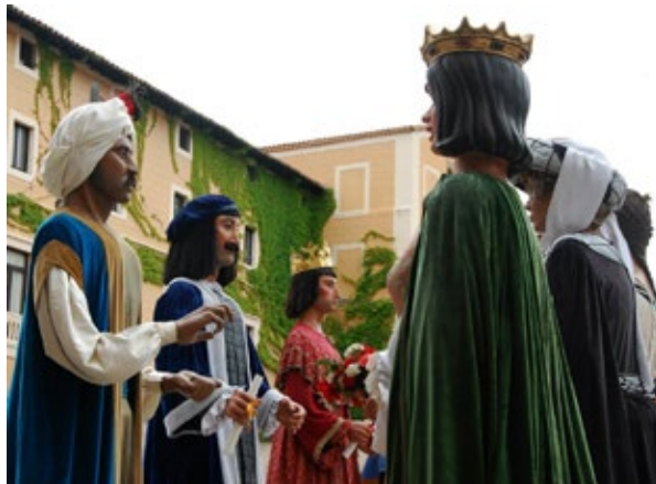
Vals dels Novençans a Badalona, el 2014.

Cal dir, però, que Abellan i Grau deixaven clar prèviament: No ens referim a les evolucions mig de pas i mig de dansa de les desfílades, ni tampoc als balls fets amb més o menys traça però a criteri del geganter. Ens referim a aquells balls que es fan en un moment ritual de la festa en que els gegants en són els màxims protagonistes . Així doncs, podríem dir que el Ball de Gegants com a tal és una disciplina, és un art i la màxima expressió d'aquestes figures. De fet, observant el