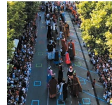
Moment de la Flashmoob XXL que es va fer a Arenys de Mar que va omplir la Riera d'Arenys de diverses colles l'any 2011

Barcelona del Pi i Santa Maria del Mar, el ball de la Marató de TV3 a Santa Coloma de Gramenet de l'any 2000, el Renaixement Gegant de Badalona que es porta a terme des de 1997, el Flashmoob XXL del 2011 a Arenys de Mar, la Sardana Gegant del 2012 a Arenys de Munt o el Ball del Ciri del 2019 a Castellterçol, per citar-ne uns quants.