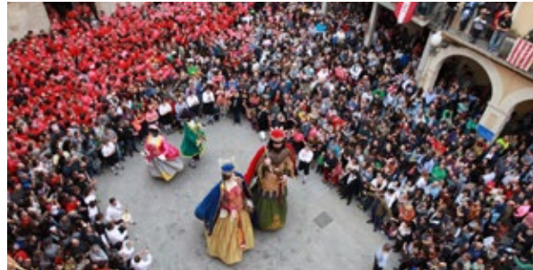
Els gegants de Valls fent el seu ballet a la plaça del Blat la diada de Sant Joan de 2016.

les dades del vostre ball de gegants omplint el qüestionari que trobareu al portal de l'Inventari ( www.danses.cat ) i que us pot facilitar l'ordenació de la infromació, o bé enviant-nos un missatge amb la informació ( dansesvives@esbartcatala.org ). També trobem manifestacions coreogràfiques en les que els gegants comparteixen ball amb balladors i balladores, com seria el cas dels balls dels gegants del Ball de Mantons d'Ulldecona, del Ball de cavallets, gegants i mulassa de Sant Feliu de Pallerols o del Ball de morratxes de Sant Pol de Mar. En altres casos, els gegants a través del seu ball expliquen una acció, la més coneguda l'enamorament d'una parella com en el cas dels Gegants de la Ciutat de Barcelona, històrica o llegendària com passa ala Batalla de Montornès del vallès.