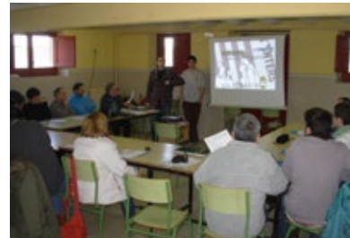
Seminari de balls de gegants a la Ruca de Moià. 20/2/2010.

L'ACGC va buscar persones amb experiència per a fomentar i estimular a les colles, promocionant cursos de balls i gralla i publicant els llibrets "Ball de gegants" i "20 peces per a gralla seca", incloent l'enregistrament de les 20 peces, amb la col·laboració d'en Jan Grau i d'en Jordi Fàbregas.