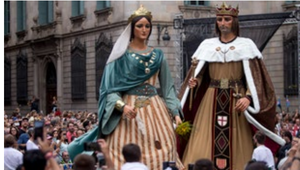
Els gegants de la ciutat de Barcelona fent el seu ball la Diada de la Mercè del 2018.

L' Inventari de danses vives de Catalunya compleix aquests objectius posant a l'abast de la ciutadania el portal que conté la informació de les danses que es van inventariant.