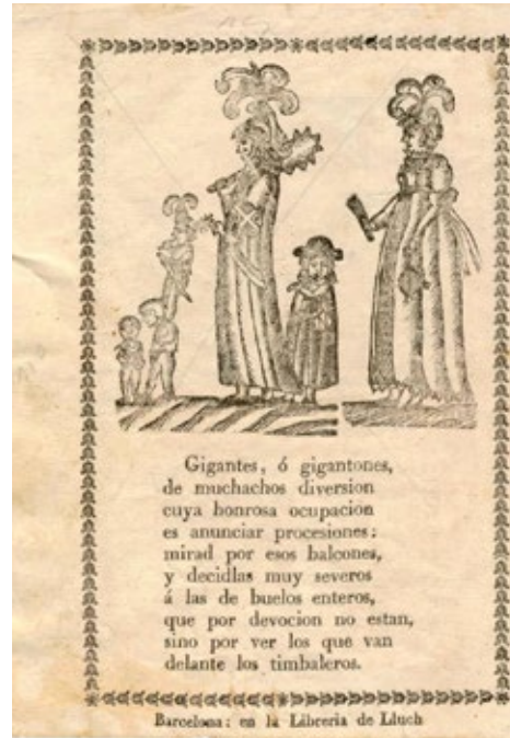
Ventall setcentista.

Fem un salt en el temps i ens plantem amb segle XVIII, un altre temps de canvis pel què fa a gegants. Va començar el segle amb la guerra de Successió, que va culminar amb el Decret de Nova Planta i la requisita de tots els entremesos festius, i va acabar amb les prohibicions eclesiàstiques. Podríem dir que les primeres imatges de què disposem de gegants són les aparegudes en aquesta època en ventalls i fulls de rengle. En aquestes imatges invariablement apareixen els gegants acompanyats d'un sol músic sonant flabiol i tamborí. No sabem però si aquest ja era l'acompanyament habitual dels gegants d'abans. En les referències de gegants, d'aquesta època ja es parla de manera normal de ballar els gegants en plural, és a dir la parella. El Baró de Maldà en el seus llibres "El Calaix de Sastre"(1769-1819), el els quals sovintegen les referències als gegants del Pi, pràcticament sempre quan els esmenta que surten al carrer s'hi refereix dient què ballen.